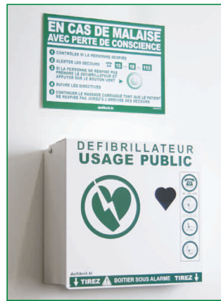
EN CAS DE MALAISE Dimensions : 210*297 Réf. : DS 040812

Une signalétique pour éviter de perdre un temps précieux à chercher le défibrillateur Trouver rapidement le lieu de l'appareil optimise les chances de survie du patient.