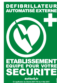
ETABLISSEMENT EQUIPÉ Dimensions : 140*210 Réf. : DS 040808