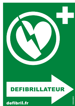
DIRECTIONNELLE (gauche et droite) Dimensions : 105*148 Réf. gauche : DS 040805 Réf. droite : DS 040803