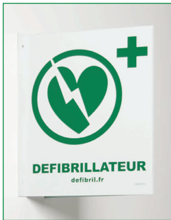
LOCALISATION Dimensions : 200*250 Réf. : DS 040815