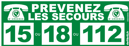
SECOURS 15-18-112 Dimensions : 140*50 Réf. : DS040809

Une signalétique pour éviter de perdre un temps précieux à chercher le défibrillateur Trouver rapidement le lieu de l'appareil optimise les chances de survie du patient.